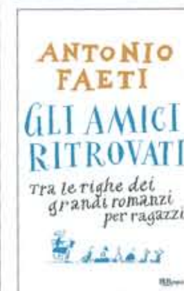
Qui sopra, le copertine dei volumi "La Prateria degli Asfodeli" (Bononia University Press 2010) e di "Gli amici ritrovati" (Rizzoli 2010), libro che raccoglie le note per la collana "I delfini" e sul quale torneremo in sede di recensione.