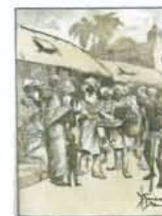
Qui, immagini interne e una copertina delle letture d'infanzia di Faeti.