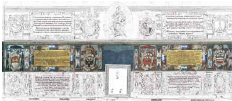
aula VI dei Legisti, seconda fascia, parete nord (n. 643-648)