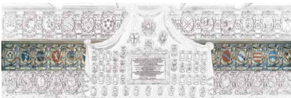
aula VI dei Legisti, seconda fascia, parete est (n. 649-660)