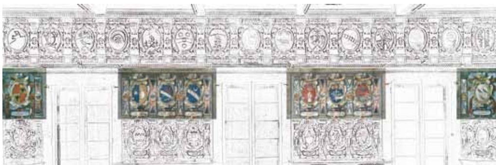
aula VI dei Legisti, seconda fascia, parete ovest (n. 669-676)